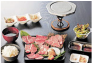
「夢照らす」のメニュー (見本)

「あわじグリーン館」は淡路夢舞台にある日本最大級の温室。現在、きらびやかなイルミネーションが楽しめる「ウィンターガーデン」を開催中 (26年1月12日まで)。同館隣接の展望テラス内にある「夢照らす」では、淡路牛をリーズナブルに楽しめる焼き肉セットや期間限定のクリスマスメニューをご用意。暖かな温室と上質な淡路牛で、心と舌を満たすひとときをどうぞ。入館券と食事券の有効期限は26年3月31日まで (休館日・定休日あり)。