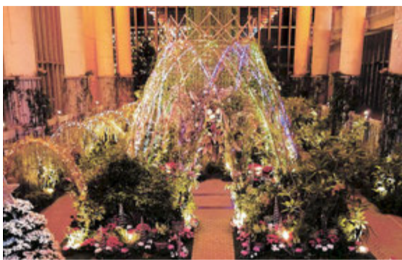
ウィンターガーデン

「あわじグリーン館」は淡路夢舞台にある日本最大級の温室。現在、きらびやかなイルミネーションが楽しめる「ウィンターガーデン」を開催中 (26年1月12日まで)。同館隣接の展望テラス内にある「夢照らす」では、淡路牛をリーズナブルに楽しめる焼き肉セットや期間限定のクリスマスメニューをご用意。暖かな温室と上質な淡路牛で、心と舌を満たすひとときをどうぞ。入館券と食事券の有効期限は26年3月31日まで (休館日・定休日あり)。